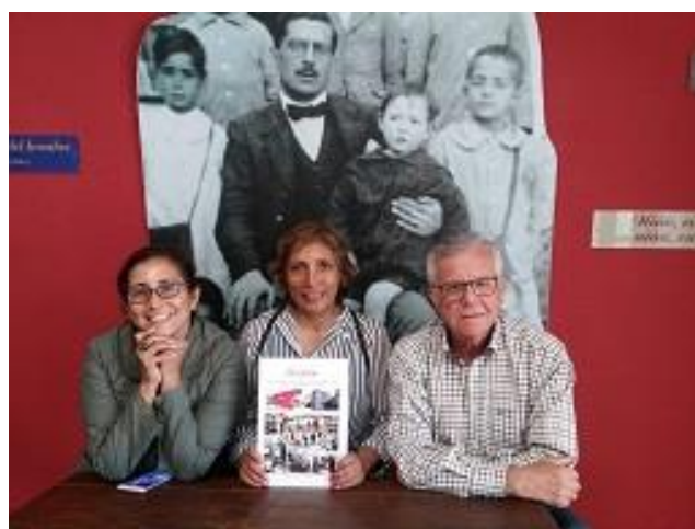
Profesoras de la Universidad de San Marcos (decano de América). Lima (Perú).