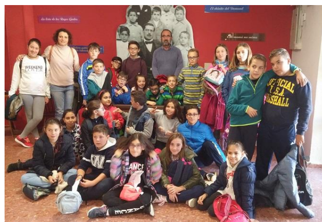
Alumnos del Colegio de Balazote (Albacete)

A pesar del horario restringido que tiene el museo (solo abre en horario escolar y cierra fines de semana, festivos y vacaciones), el museo ha recibido en nueve meses, de octubre de 2017 a junio de 2018, más de 5.000 visitas. Aparte de grupos de escolares, también nos han visitado personas de Asociaciones Culturales, Residencias de Mayores y estudiantes de Secundaria y Universitarios. La procedencia, principalmente Albacete y provincias limítrofes. También de otros lugares de España y del extranjero (Portugal, Francia, Finlandia, Noruega, Perú...).