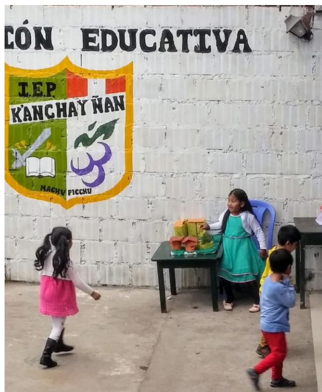
Foto tomada en Aguas Calientes (Machu Pichu). Institución Educativa (Escuela) privada. En el recreo los niños toman su bocadillo y zumos elaborados por la propia institución.